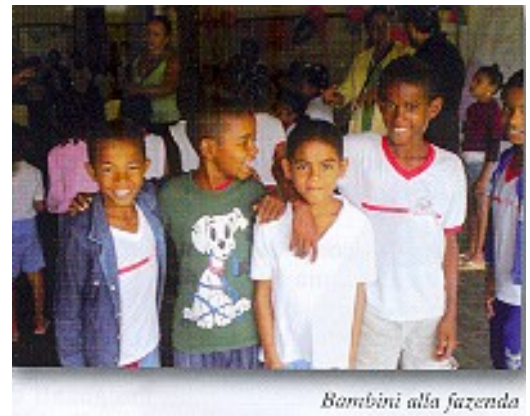
Bambini alla fazenda