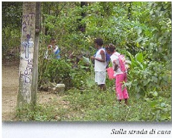
Sulla strada di casa