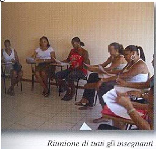
Riunione di tutti gli insegnanti