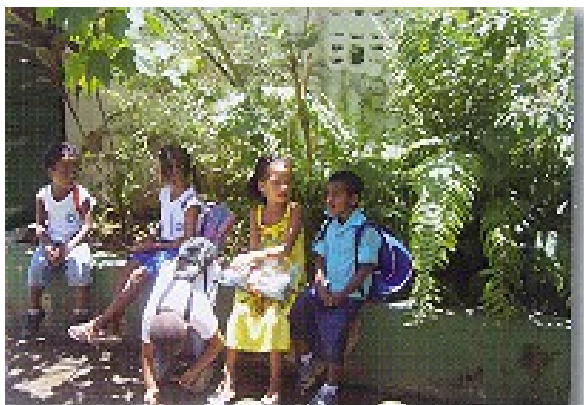
I bambini della materna di Bom Juá aspettano i genitori