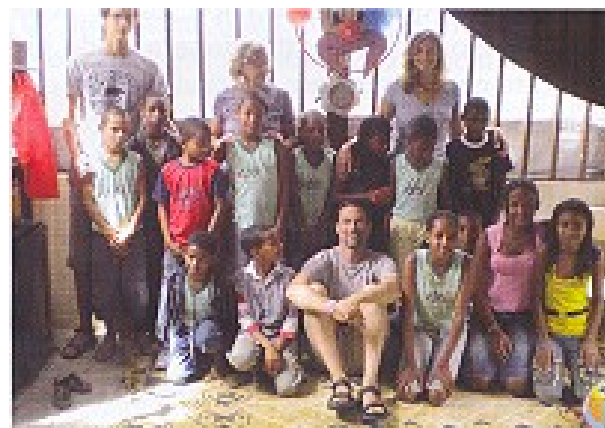
In classe ad Alto do Riachinho

Come tutti sapete queste spese sono extra e non sono compresi nelle rette che i padrini ci danno per il mantenimento dei bambini a scuola e quindi affronteremo questo nuovo impegno economico sperando nella collaborazione dei nostri molti amici.