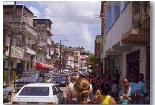
Il bairro animato per le elezioni