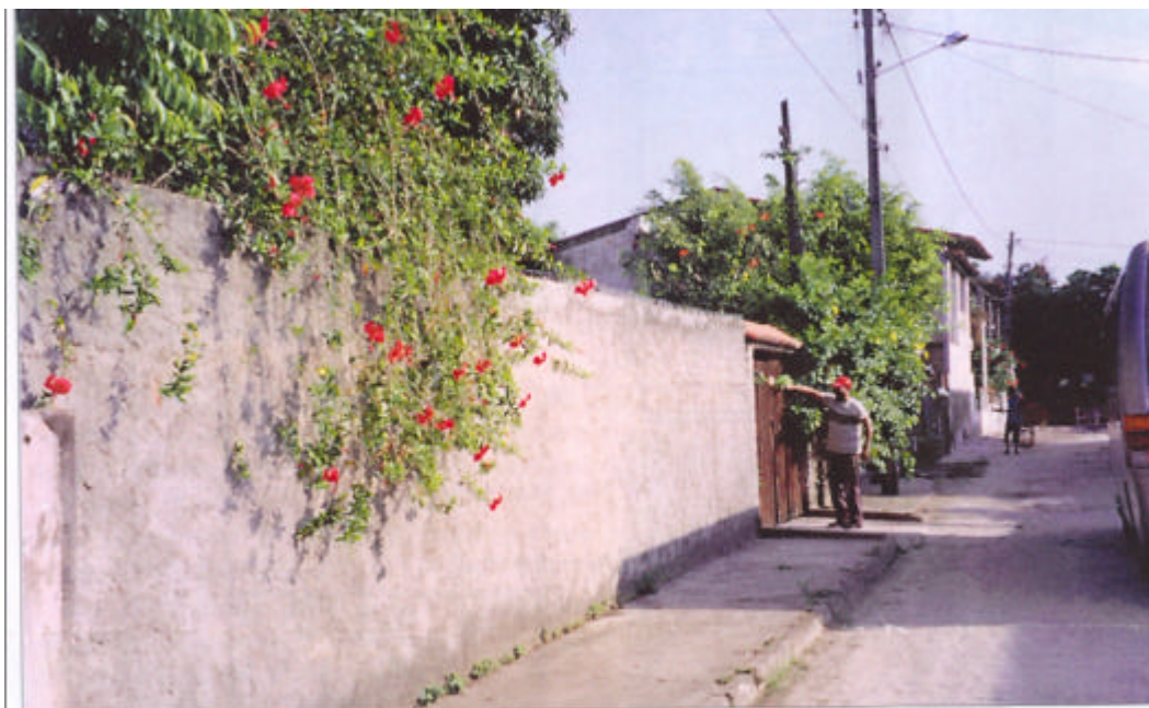
Vista di fronte del terreno acquistato

Giovani d'ambo i sessi d'età compresa fra i 13 ed i 20 anni, che frequentano regolarmente le scuole medie e superiori ma che, per le tante carenze dell'insegnamento pubblico ed anche per i continui scioperi, necessitano di alcune integrazioni per avere una preparazione adeguata.