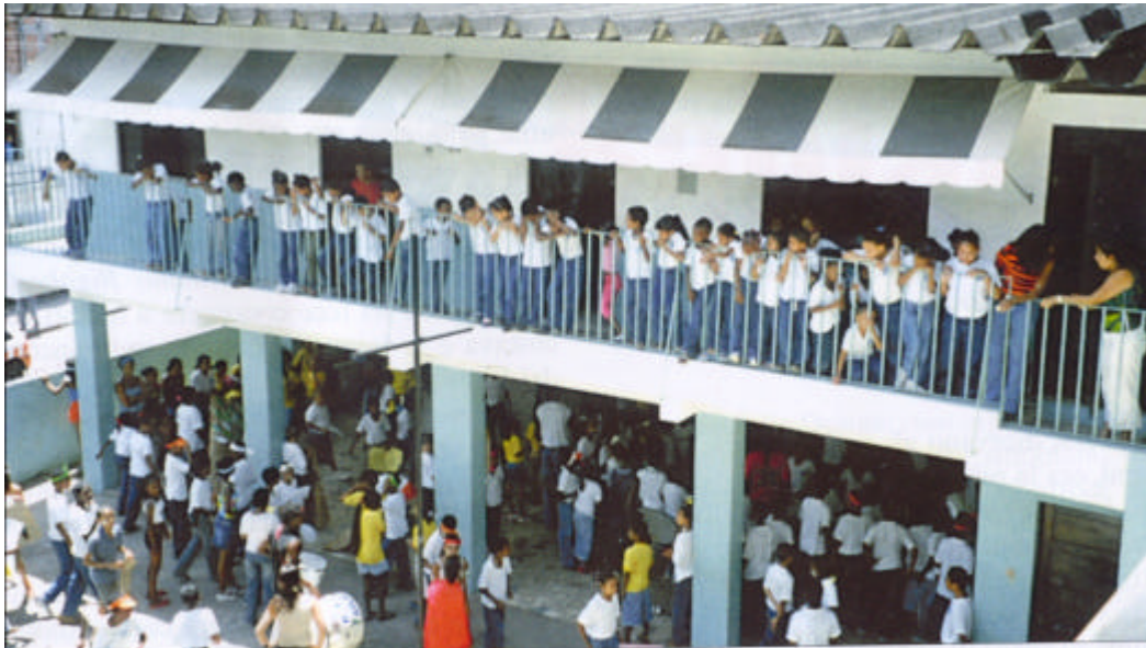
Bom Juà scuola comunitaria

A fine corso, ai ragazzi più meritevoli, verrà riconosciuto un modesto premio economico e la possibilità di lavorare come stagisti nelle varie strutture della nostra associazione.