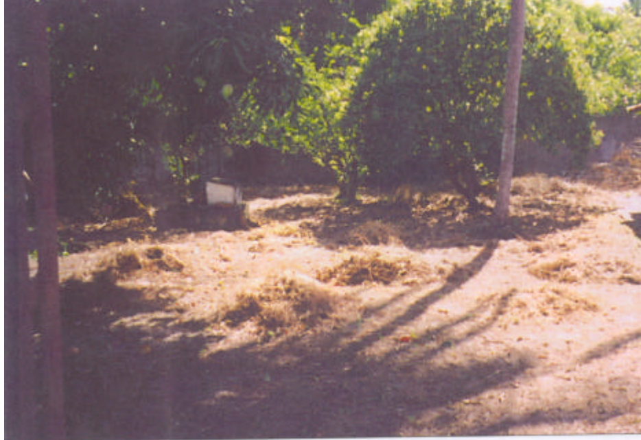
Area laterale dove verrà costruito il Centro

Scopo di questi corsi è imparare ad usare nuove tecnologie che migliorino le loro capacità produttive e che diano loro la possibilità di crearsi un percorso professionale, polivalente e flessibile che li porti anche a svolgere, se questo fosse il loro desiderio, un'attività imprenditoriale. Tutto ciò, ovviamente, senza rinunciare alle loro attitudini ed alle loro caratteristiche individuali.